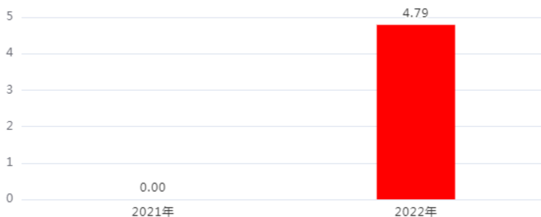
收、支决算总计变动情况图（单位：万元）

2022年度收、支总计4.79万元。与上年不可比，不可比的主要原因是：2022年预算为按工作人员计算的办公费，不含其它项目费用。