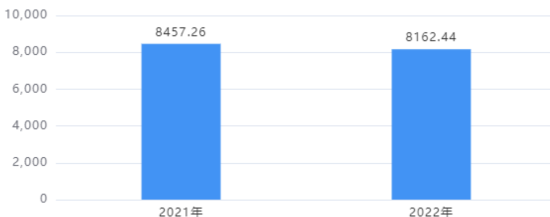
一般公共预算财政拨款支出决算变动情况图（单位：万元）

2022年度一般公共预算财政拨款支出8,162.44万元，占本年支出合计的99.00%。与2021年度相比，一般公共预算财政拨款支出减少294.82万元，下降3.49%。主要是根据上级财政要求压缩项目经费。