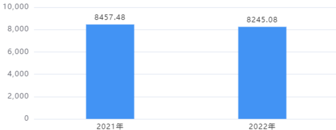
财政拨款收、支决算总计变动情况图（单位：万元）

2022年度财政拨款收、支总计8,245.08万元。与2021年度相比，财政拨款收、支总计各减少212.40万元，下降2.51%。主要是根据上级财政要求压缩项目经费。