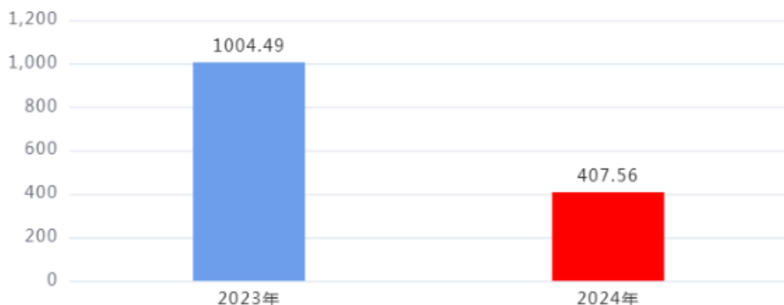
收、支决算总计变动情况图（单位：万元）

2024年度收、支总计407.56万元。与2023年度相比，收、支总计各减少596.93万元，下降59.43%，主要原因是：年内项目减少所致。