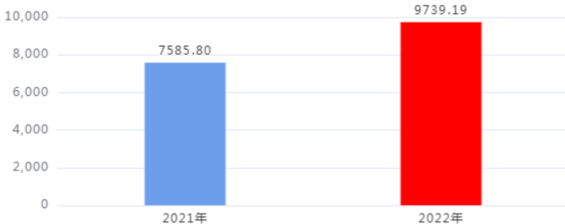
财政拨款收、支决算总计变动情况图（单位：万元）

2022年度财政拨款收、支总计9,739.19万元。与2021年度相比，财政拨款收、支总计各增加2,153.39万元，增长28.39%。主要是人员经费增加。