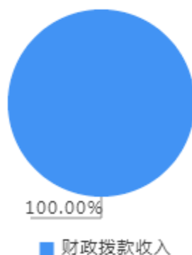
本年收入决算结构图

本年收入合计9,739.19万元，其中：财政拨款收入9,739.19万元，占100.00%。