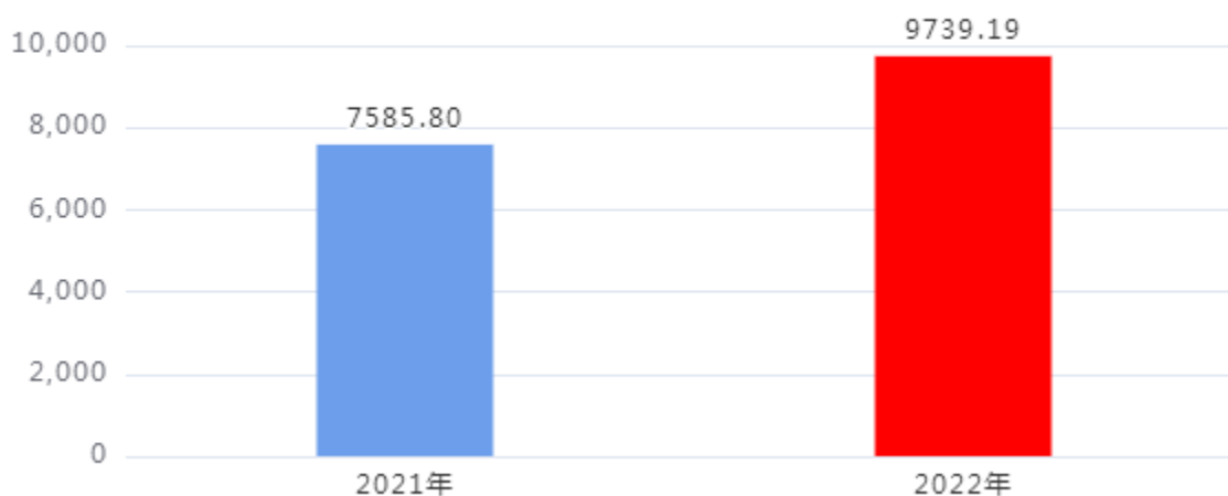
收、支决算总计变动情况图（单位：万元）

2022年度收、支总计9,739.19万元。与2021年度相比，收、支总计各增加2,153.39万元，增长28.39%。主要是人员经费增加。