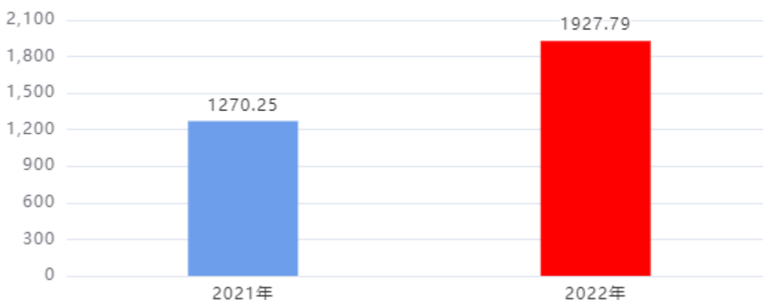
一般公共预算财政拨款支出决算变动情况图（单位：万元）

2022年度一般公共预算财政拨款支出1,927.79万元，占本年支出合计的100.00%。与2021年度相比，一般公共预算财政拨款支出增加657.54万元，增长51.76%。主要是人员经费增加、学生人数增加。