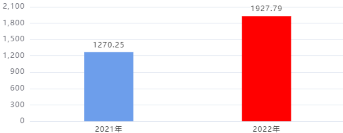
收、支决算总计变动情况图（单位：万元）

2022年度收、支总计1,927.79万元。与2021年度相比，收、支总计各增加657.54万元，增长51.76%。主要是人员经费增加、学生人数增加。