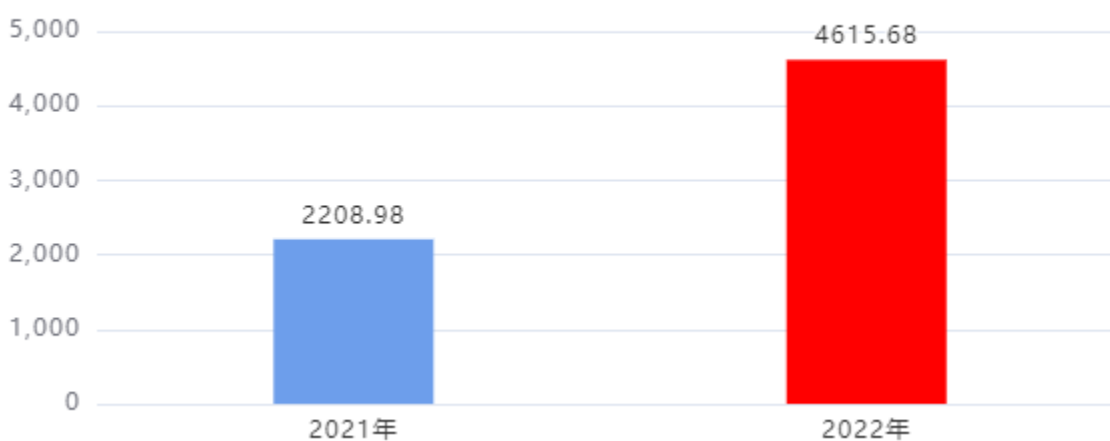
一般公共预算财政拨款支出决算变动情况图（单位：万元）

2022年度一般公共预算财政拨款支出4,615.68万元，占本年支出合计的100.00%。与2021年度相比，一般公共预算财政拨款支出增加2,406.70万元，增长108.95%。主要是人员经费和公用经费增加。