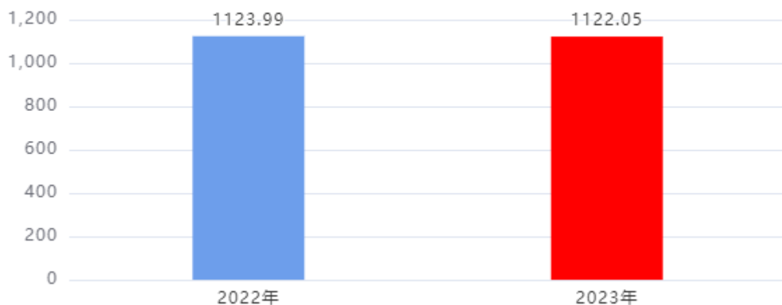
一般公共预算财政拨款支出决算变动情况图（单位：万元）

2023年度一般公共预算财政拨款支出1,122.05万元，占本年支出合计的87.93%。与2022年度相比，一般公共预算财政拨款支出减少1.94万元，下降0.17%，主要是：2023年有教师退休。