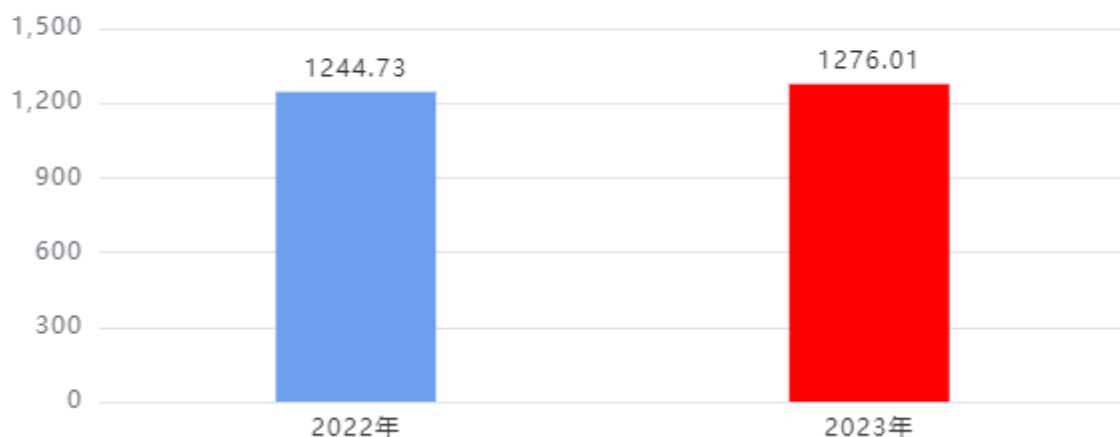
收、支决算总计变动情况图（单位：万元）

2023年度收、支总计1,276.01万元。与2022年度相比，收、支总计各增加31.28万元，增长2.51%，主要原因是：人员增资和生均公用经费提高。