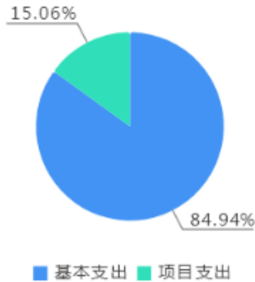
本年支出决算结构图

本年支出合计11,953.69万元，其中：基本支出10,152.9万元，占84.94%；项目支出1,800.79万元，占15.06%。