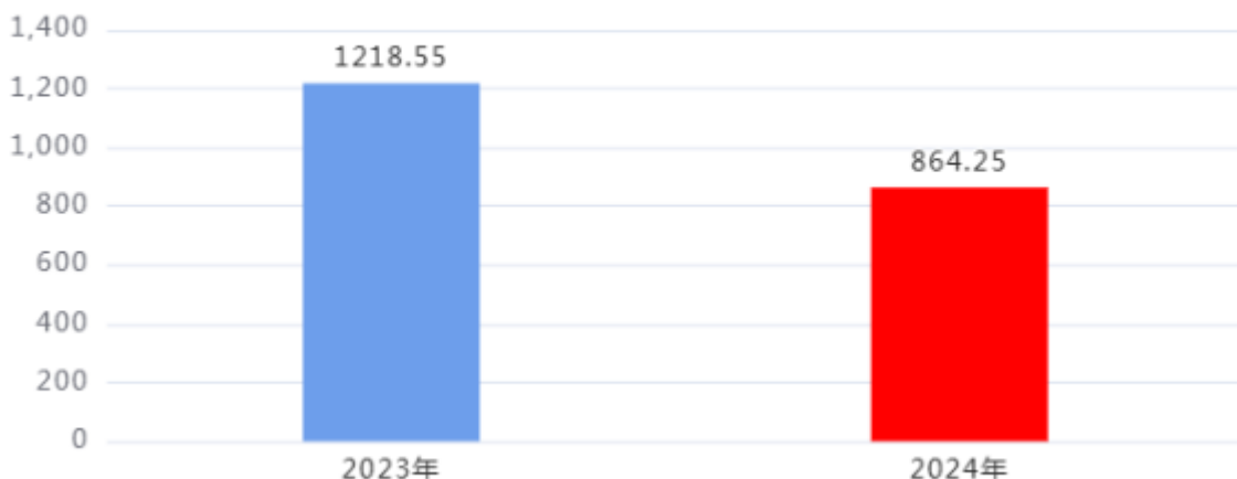
一般公共预算财政拨款支出决算变动情况图（单位：万元）

2024年度一般公共预算财政拨款支出864.25万元，占本年支出合计的100%。与2023年度相比，一般公共预算财政拨款支出减少354.3万元，下降29.08%，主要原因是：决算数大于年初预算数的主要原因是各项费用有所减少。