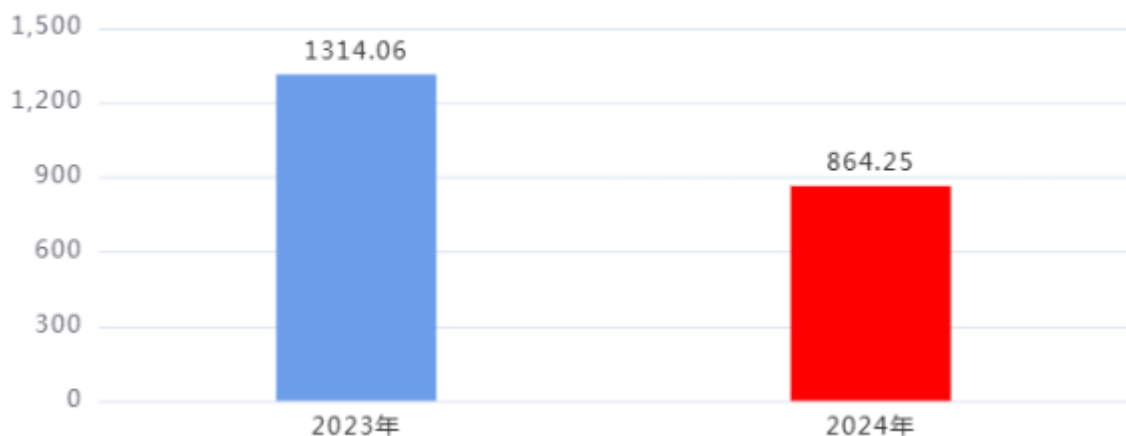
财政拨款收、支决算总计变动情况图（单位：万元）

2024年度财政拨款收、支总计864.25万元。与2023年度相比，财政拨款收、支总计各减少449.81万元，下降34.23%，主要原因是：各项费用有所减少。