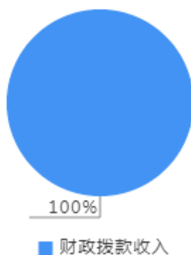
本年收入决算结构图

本年收入合计2,666.57万元，其中：财政拨款收入2,666.57万元，占100%。