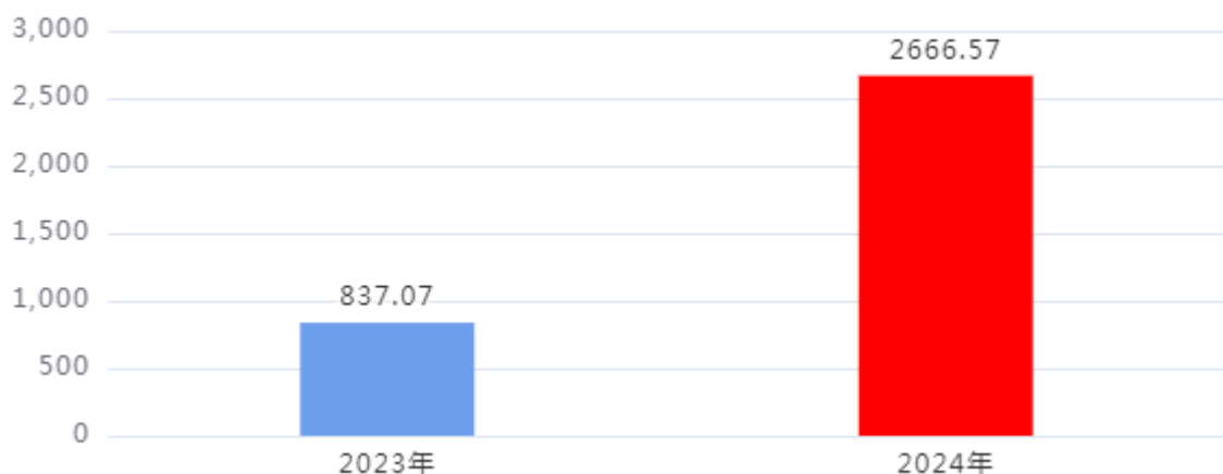
财政拨款收、支决算总计变动情况图（单位：万元）

2024年度财政拨款收、支总计2,666.57万元。与2023年度相比，财政拨款收、支总计各增加1,829.5万元，增长218.56%，主要原因是：人员经费增加。