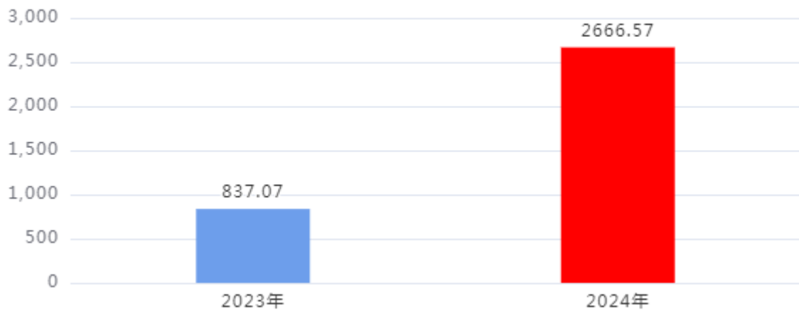
一般公共预算财政拨款支出决算变动情况图（单位：万元）

2024年度一般公共预算财政拨款支出2,666.57万元，占本年支出合计的100%。与2023年度相比，一般公共预算财政拨款支出增加1,829.5万元，增长218.56%，主要原因是：人员经费增加。