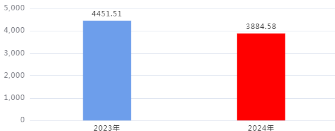
收、支决算总计变动情况图（单位：万元）

2024年度收、支总计3,884.58万元。与2023年度相比，收、支总计各减少566.93万元，下降12.74%，主要原因是：本年度学生数比上年减少，所以本年度总收、支减少。