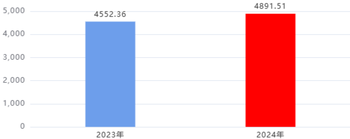
一般公共预算财政拨款支出决算变动情况图（单位：万元）

2024年度一般公共预算财政拨款支出4,891.51万元，占本年支出合计的100%。与2023年度相比，一般公共预算财政拨款支出增加339.15万元，增长7.45%，主要原因是：1. 学校学生增加，经费随之增加。2. 人员经费增加。