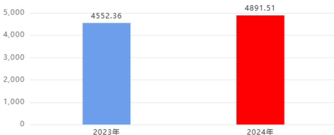
收、支决算总计变动情况图（单位：万元）

2024年度收、支总计4,891.51万元。与2023年度相比，收、支总计各增加339.15万元，增长7.45%，主要原因是：1. 学校学生增加，经费随之增加。2. 人员经费增加。。