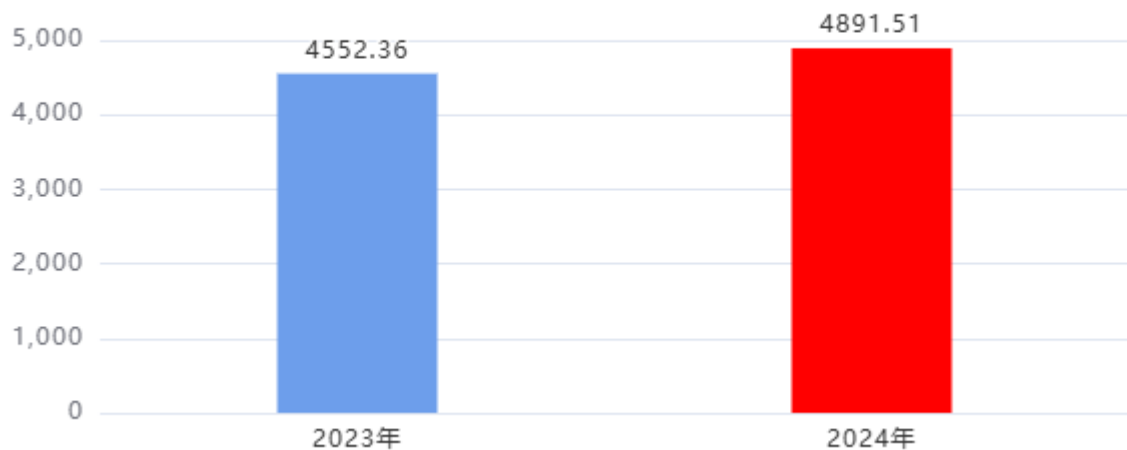
财政拨款收、支决算总计变动情况图（单位：万元）

2024年度财政拨款收、支总计4,891.51万元。与2023年度相比，财政拨款收、支总计各增加339.15万元，增长7.45%，主要原因是：1. 学校学生增加，经费随之增加。2. 人员经费增加。