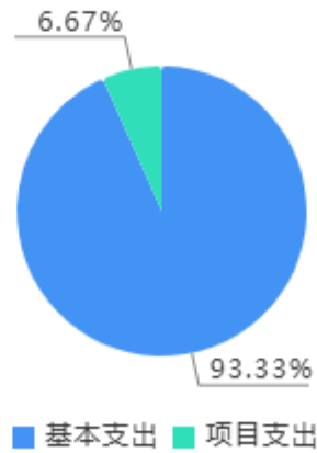
本年支出决算结构图

本年支出合计4,891.51万元，其中：基本支出4,565.21万元，占93.33%；项目支出326.3万元，占6.67%。