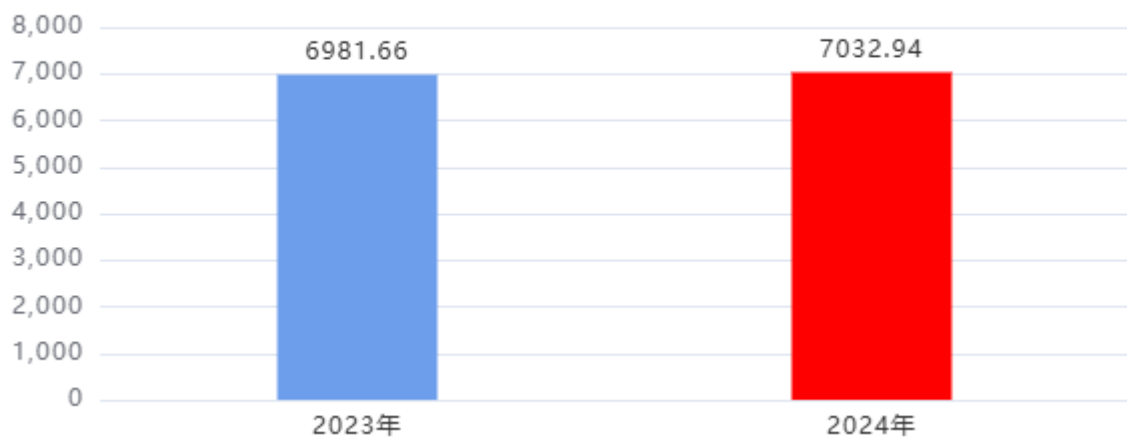
财政拨款收、支决算总计变动情况图（单位：万元）

2024年度财政拨款收、支总计7,032.94万元。与2023年度相比，财政拨款收、支总计各增加51.28万元，增长0.73%，主要原因是：公用经费增加。