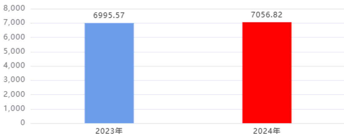
收、支决算总计变动情况图（单位：万元）

2024年度收、支总计7,056.82万元。与2023年度相比，收、支总计各增加61.25万元，增长0.88%，主要原因是：公用经费增加。