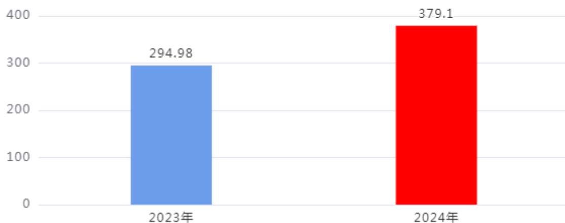
收、支决算总计变动情况图（单位：万元）

2024年度收、支总计379.1万元。与2023年度相比，收、支总计各增加84.12万元，增长28.52%，主要原因是：我单位2024年启用两所新园，人员成本、日常办公成本增多，进而导致全年收支总额也增多。