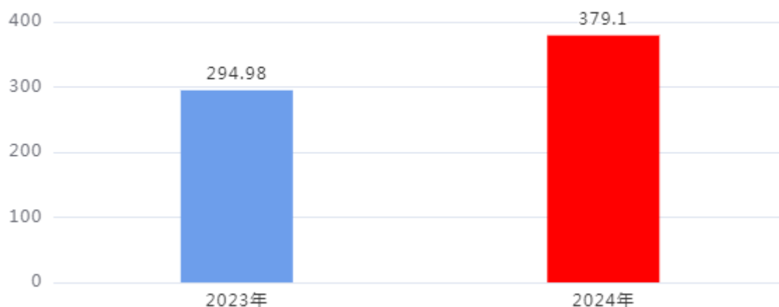
财政拨款收、支决算总计变动情况图（单位：万元）

2024年度财政拨款收、支总计379.1万元。与2023年度相比，财政拨款收、支总计各增加84.12万元，增长28.52%，主要原因是：我单位2024年启用两所新园，人员成本、日常办公成本增多，进而导致财政拨款收支总额也增多。