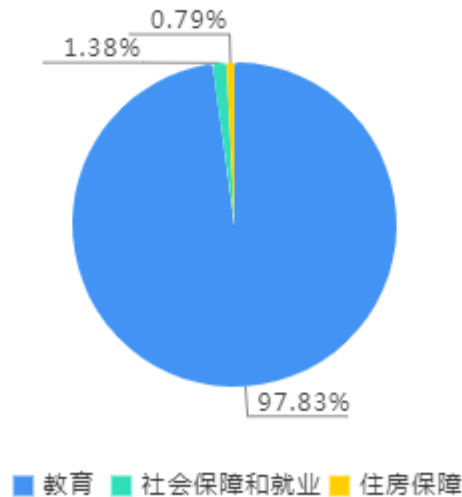
一般公共预算财政拨款支出决算结构图