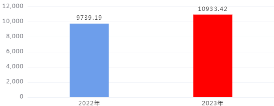
财政拨款收、支决算总计变动情况图（单位：万元）

2023年度财政拨款收、支总计10,933.42万元。与2022年度相比，财政拨款收、支总计各增加1,194.23万元，增长12.26%，主要是：生均经费标准提高，学生数增加。