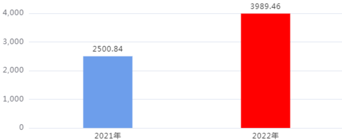
财政拨款收、支决算总计变动情况图（单位：万元）

2022年度财政拨款收、支总计3,989.46万元。与2021年度相比，财政拨款收、支总计各增加1,488.62万元，增长59.52%。主要是1. 学校学生增加，经费随之增加。2. 人员经费增加。