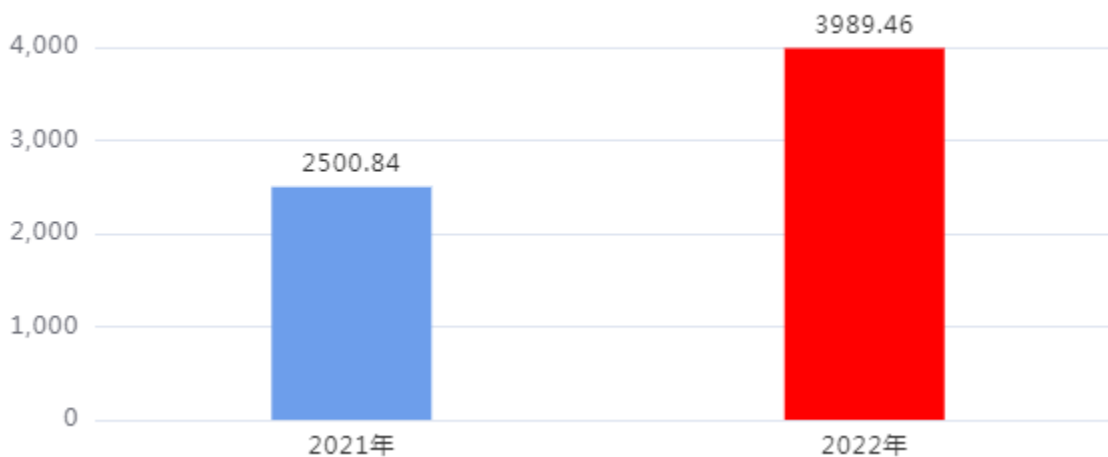
一般公共预算财政拨款支出决算变动情况图（单位：万元）

2022年度一般公共预算财政拨款支出3,989.46万元，占本年支出合计的100.00%。与2021年度相比，一般公共预算财政拨款支出增加1,488.62万元，增长59.52%。主要是1. 学校学生增加，经费随之增加。2. 人员经费增加。