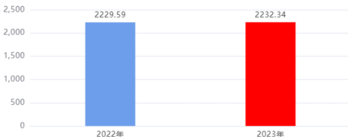
财政拨款收、支决算总计变动情况图（单位：万元）

2023年度财政拨款收、支总计2,232.34万元。与2022年度相比，财政拨款收、支总计各增加2.75万元，增长0.12%，主要是：公用经费增加。