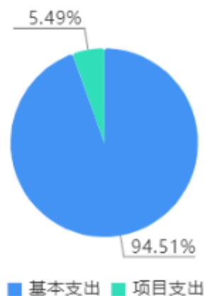
本年支出决算结构图

本年支出合计2,232.34万元，其中：基本支出2,109.89万元，占94.51%；项目支出122.46万元，占5.49%。（金额单位转换时，存在尾数误差。）