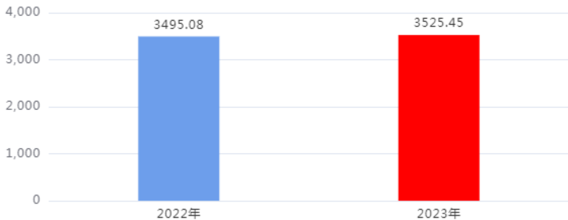
一般公共预算财政拨款支出决算变动情况图（单位：万元）

2023年度一般公共预算财政拨款支出3,525.45万元，占本年支出合计的100%。与2022年度相比，一般公共预算财政拨款支出增加30.37万元，增长0.87%，主要是：人员经费增加。