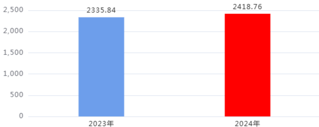
一般公共预算财政拨款支出决算变动情况图（单位：万元）

2024年度一般公共预算财政拨款支出2,418.76万元，占本年支出合计的100%。与2023年度相比，一般公共预算财政拨款支出增加82.92万元，增长3.55%，主要原因是：2023年部分项目列入了政府性基金预算财政拨款支出。