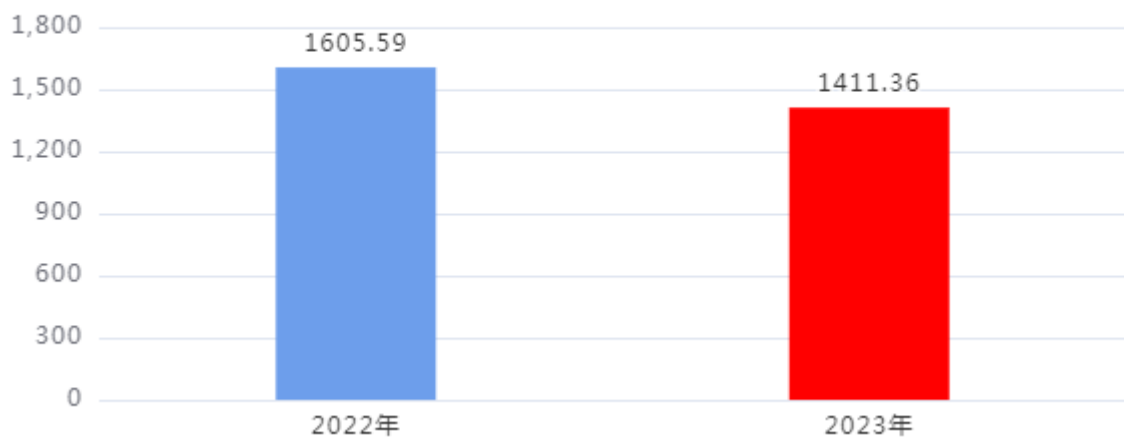
财政拨款收、支决算总计变动情况图（单位：万元）

2023年度财政拨款收、支总计1,411.36万元。与2022年度相比，财政拨款收、支总计各减少194.23万元，下降12.1%，主要是：贯彻落实上级过紧日子要求，厉行节约，压减非刚性支出。