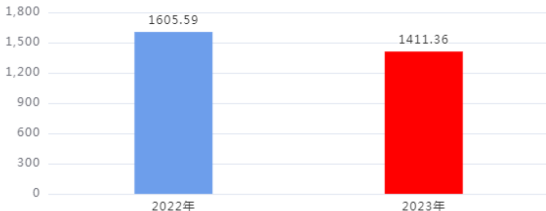
收、支决算总计变动情况图（单位：万元）

2023年度收、支总计1,411.36万元。与2022年度相比，收、支总计各减少194.23万元，下降12.1%，主要原因是：贯彻落实上级过紧日子要求，厉行节约，压减非刚性支出。