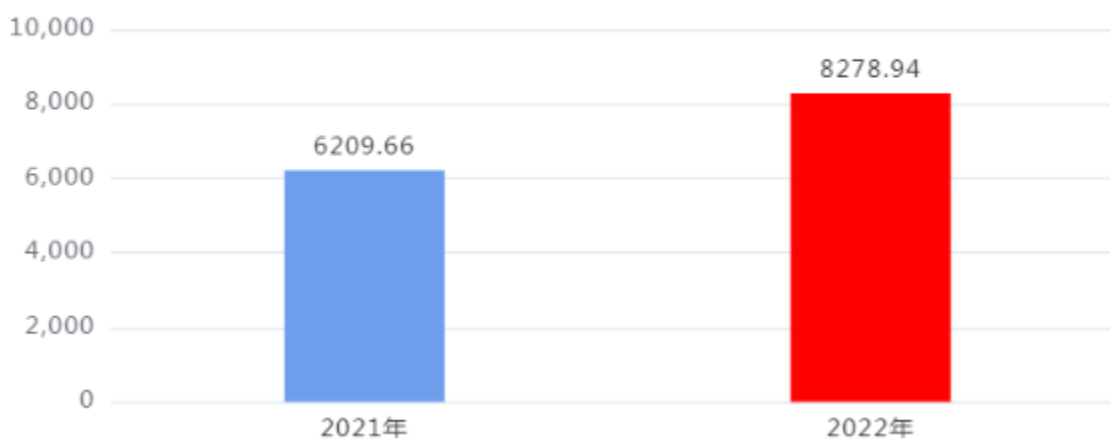
一般公共预算财政拨款支出决算变动情况图（单位：万元）

2022年度一般公共预算财政拨款支出8,278.94万元，占本年支出合计的98.83%。与2021年度相比，一般公共预算财政拨款支出增加2,069.28万元，增长33.32%。主要是财政收入增长，财力增加。