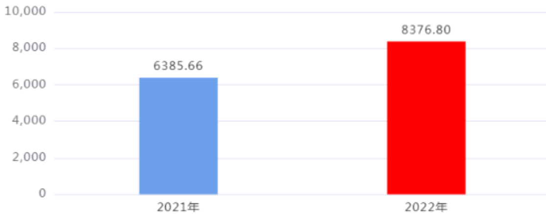
收、支决算总计变动情况图（单位：万元）

2022年度收、支总计8,376.80万元。与2021年度相比，收、支总计各增加1,991.14万元，增长31.18%。主要是财政收入增长，财力增加。