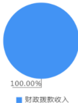
本年收入决算结构图

本年收入合计8,376.80万元，其中：财政拨款收入8,376.80万元，占100.00%。