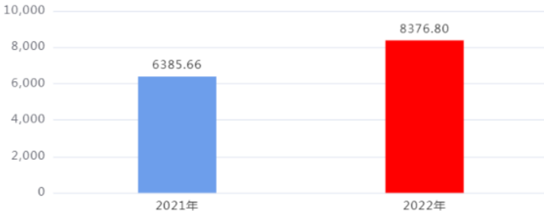
财政拨款收、支决算总计变动情况图（单位：万元）

2022年度财政拨款收、支总计8,376.80万元。与2021年度相比，财政拨款收、支总计各增加1,991.14万元，增长31.18%。主要是财政收入增长，财力增加。