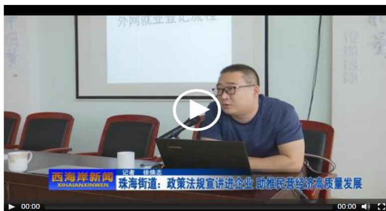
珠海街道：政策法规宣讲进企业 助推民营经济高质量发展