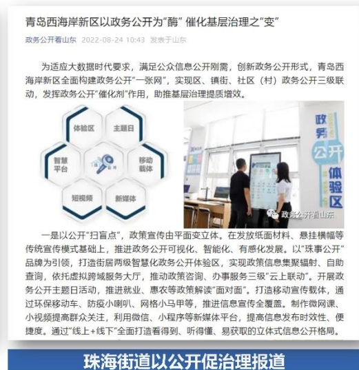
珠海街道以公开促治理报道

(一)主动公开全面深化。围绕疫情防控、稳岗就业、惠民利企、公共文化服务、优化营商环境等中心工作，主动公开政府信息 1124 条，其中，政府网站公开 448 条，政务新媒体及新闻、报纸等媒介公开 676 条，政务微信关