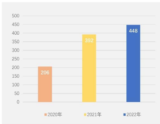
政务网站主动公开信息情况