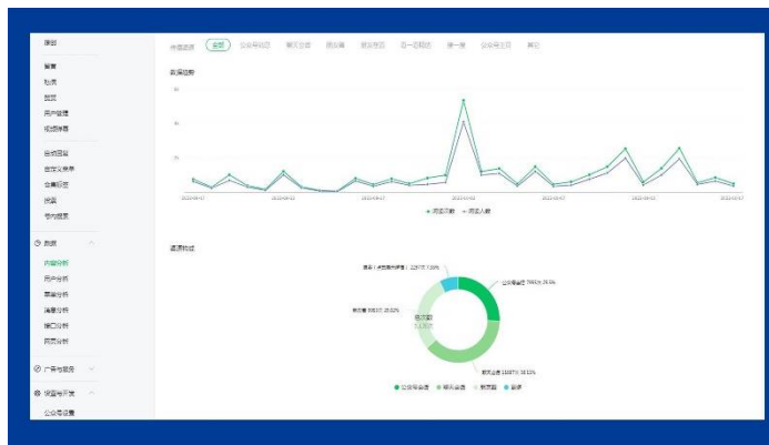
街道微信公众号数据趋势

(二)依申请公开更加规范。梳理政府信息依申请公开办理流程，印发《关于进一步规范政府信息依申请公开办理工作的通知》，建立依申请公开联审联办工作机制，加强责任部门和法律顾问会商研判，确保程序规范、答复准确。2022年新收到政府信息公开申请7件，办结3件，结转下年度继续办理4件。无因依申请公开引发的行政复议、行政诉讼。