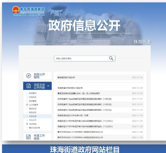
珠海街道政府网站栏目

2022 年，珠海街道政府信息公开工作坚持以习近平新时代中国特色社会主义思想为指导，全面贯彻党的二十大精神，围绕街道中心工作，聚焦发展所需、群众所盼，不断深化主动公开，依法办理依申请公开，进一步加强政府信息管理和平台建设，“珠”事公开品牌影响力持续提升，政务公开基础不断夯实，《青岛西海岸新区以政务公开为“酶”催化基层治理之变》在省政府办公厅官方微信平台刊发，以公开促落实促服务成效显著。